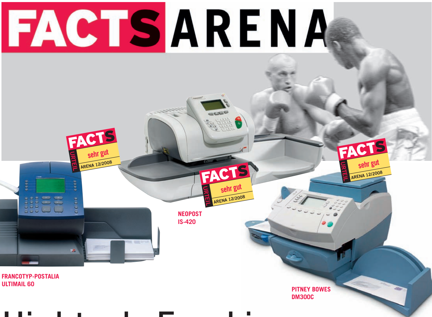
FRANCOTYP-POSTALIA ULTIMAIL 60