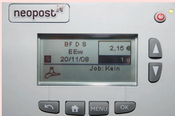
NEOPOST IS-420: Im Gegensatz zu den anderen Modellen muss der Anwender mit wenigen Tasten auskommen. Nach kurzer Eingewöhnungszeit ist das Bedienen der IS-420 aber unproblematisch.