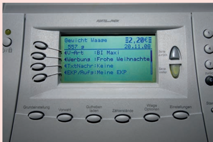
PITNEY BOWES DM 300C: Die Testredakteure kamen mit der Menüführung am Besten zurecht.