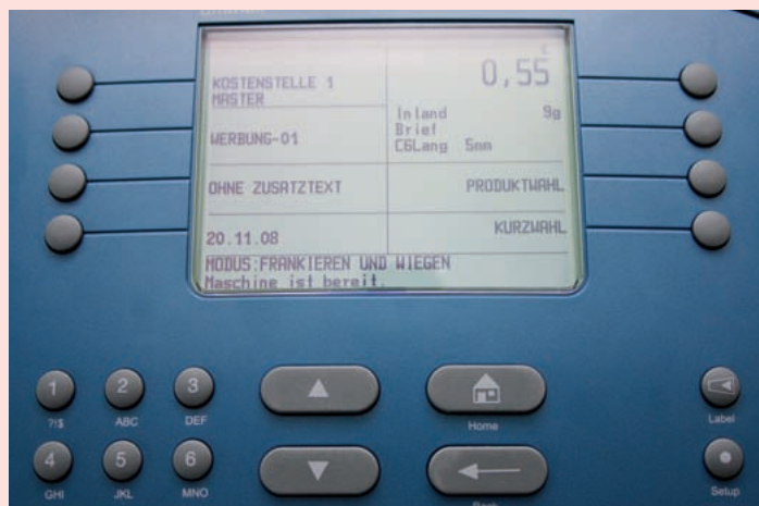
FRANCOTYP POSTALIA ultimail 60: Lässt sich schnell und einfach bedienen.

Die Bedienung war bei keinem Frankiersystem ein Problem. Pitney Bowes hatte in diesem Bereich allerdings einen, wenn auch kleinen, Punktevorsprung. Das Bedienfeld der Pitney Bowes DM 300C ist am besten strukturiert und sehr intuitiv zu bedienen. Der Bedienkomfort bei den Systemen von Francotyp-Postalia und Neopost ist aber nach einer kurzen Eingewöhnungszeit ebenfalls relativ einfach. Alle Hersteller haben die Tarifprodukte der Deutschen Post AG bereits im Gerät integriert. Bei jeder Online-Portoladung oder Verbindung aktualisiert das System bei Bedarf automatisch die Tarife. Damit die Kosten im Griff bleiben und der Anwender jederzeit einen Überblick über die Postaktivitäten hat, bietet jeder Hersteller eine passende Software an. Francotyp Postalia >