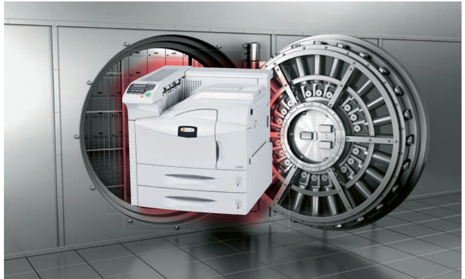
SICHERHEIT: Um den Zugriff von Unbefugten auf vertrauliche Daten via Drucker, Kopierer oder MFP zu verhindern, bietet TA Triumph-Adler verschiedene Sicherheitspakete und -tools.