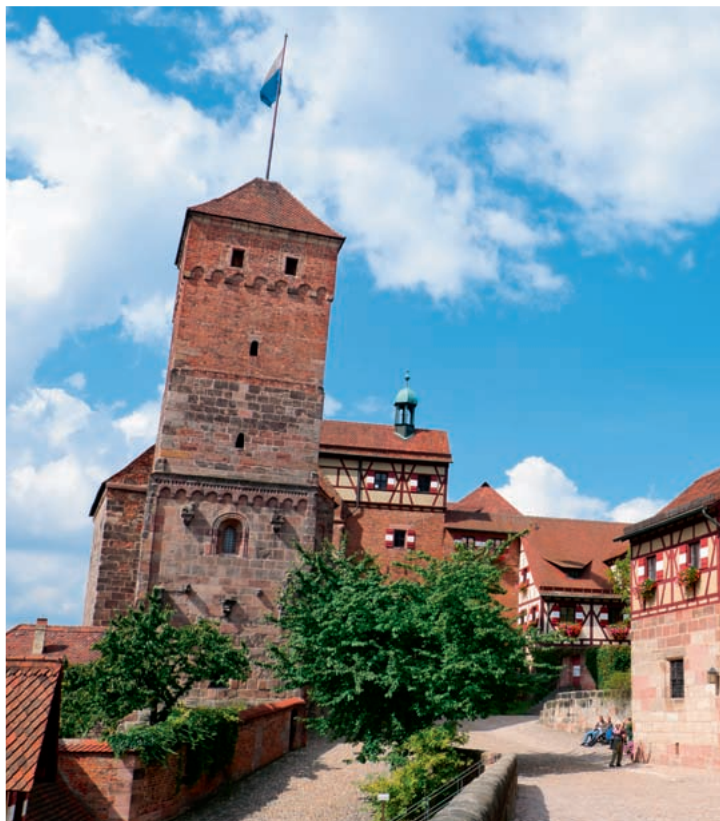
OFT ZITIERTES BEISPIEL: Die Nürnberger Bratwurst wurde nicht nur hierzulande als Marke eingetragen, sondern steht in allen anderen EU-Mitgliedsstaaten ebenfalls unter Schutz – als Wortmarke und Herkunftsangabe.

Das Interesse an der EU-Gemeinschaftsmarke ist hierzulande besonders groß. „Aus Deutschland kommen 18 Prozent aller Neu-